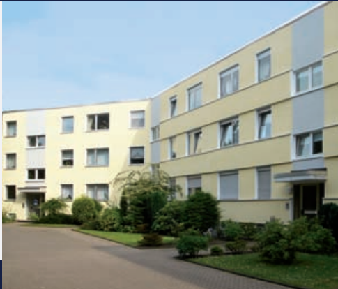
Wohnungsprivatisierungsobjekte im Auftrag der LEG

„Mit unserem erfahrenen Team stehen wir von montags bis freitags von 9.00 bis 18.00 Uhr für Beratungen und Dienstleistungen rund um die eigenen vier Wände zur Verfügung. Die PRIMMOWELT arbeitet zielorientiert.“