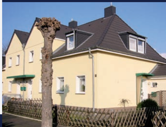
Privatisierung der ehemaligen RWE Power Immobilien